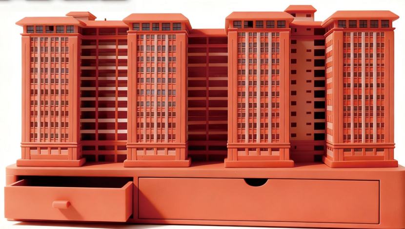
产学研楼多功能摆件